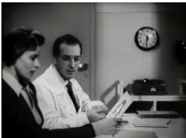
Europa '51, film de Roberto Rossellini, avec Ingrid Bergman (1952).

http://www.youtube.com/watch?v=lgDF61e0YA8